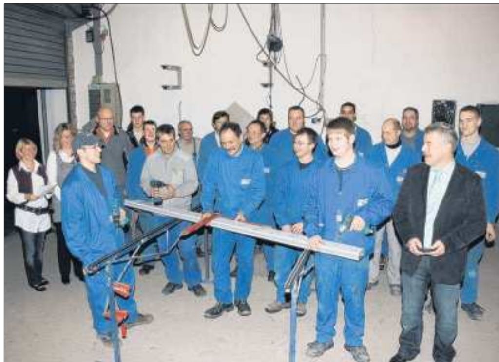
Ein starkes Team ist Garant des Erfolges: 20 Jahre Tepe & Massmann Metallbau sind für die Mitarbeiter allemal Grund zur Fröhlichkeit.